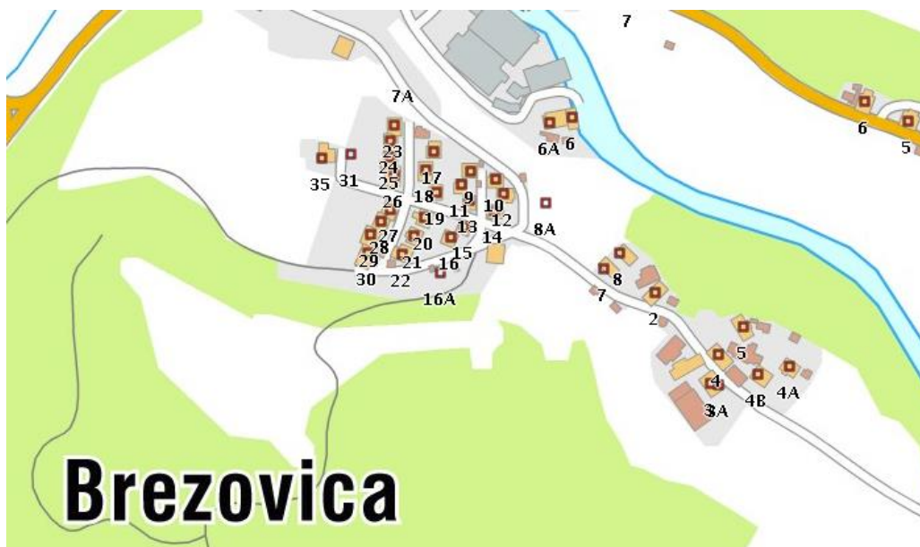
Brezovica na topografski karti, 2013