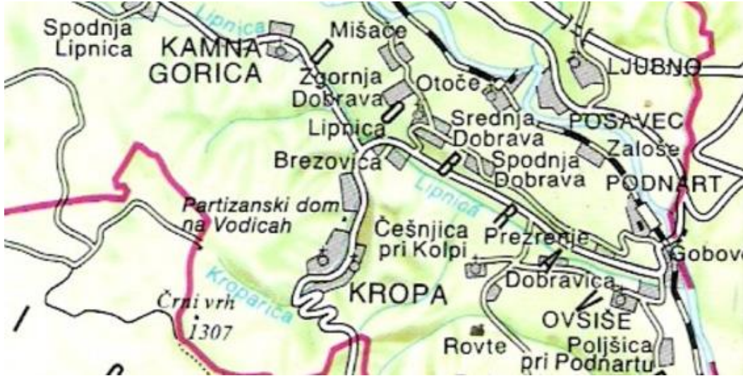
Pozicija Brezovice, 2000