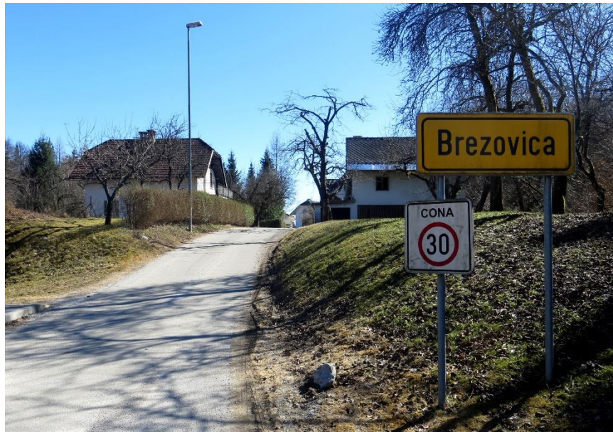
Brezovica pri Kropi, 2017