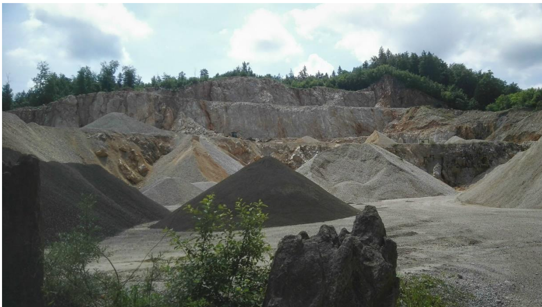
Kamnolom Brezovica, 2018