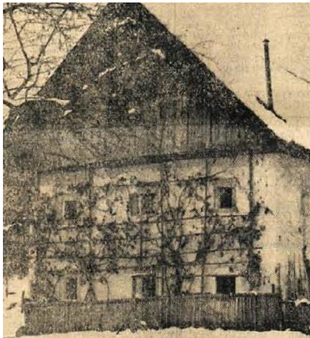
V pritličju Paplerjeve hiše so bile na Brezovici leta 1944 prve volitve v NOO na Gorenjskem.

šele zjutraj, ko sem se prebudila. V strahu, da je ne bi Nemci ali »beli« našli pri meni – oboji so precej bdeli nad mojim delom – sem v spalni srajci tekla v jutranji mraz in jo skrila pod skedenj. Zaradi tega sem se močno prehladila in nisem smela na volišče, čeprav sem si tako želela«