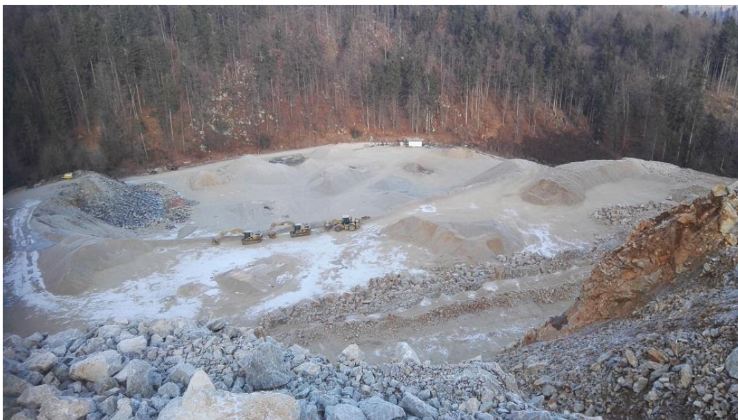
Kamnolom Brezovica

V Brezovici je pred 50 leti Radovljiška komunala odprla kamnolom, ki pa je kmalu prenehal z delovanjem. Je pa v dolini za Brezovico v obratovanju ogromen kamnolom, zajeda se v kraško skalovje in jame hriba Kamna Gorica (to ni vas Kamna Gorica) Jamarsko društvo iz Kranja ima o tem nahajališču jam in brezen bogato spletno stran.